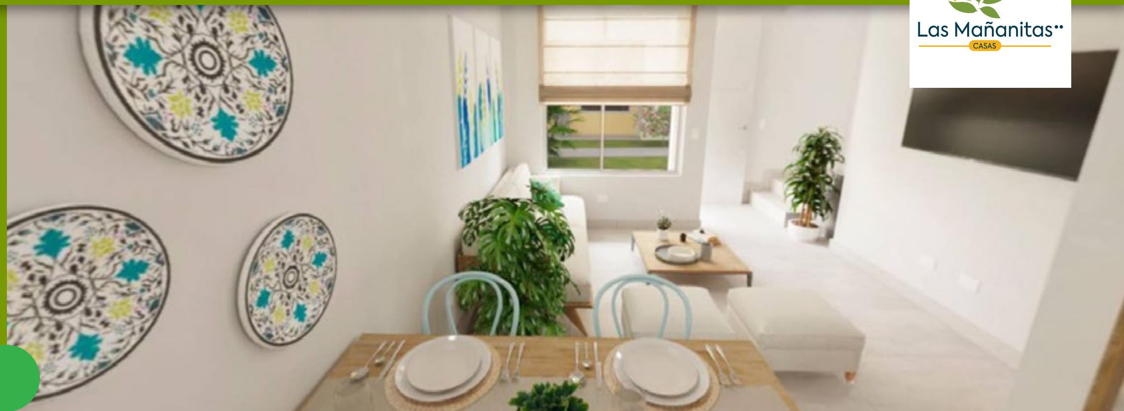
Sala - Comedor