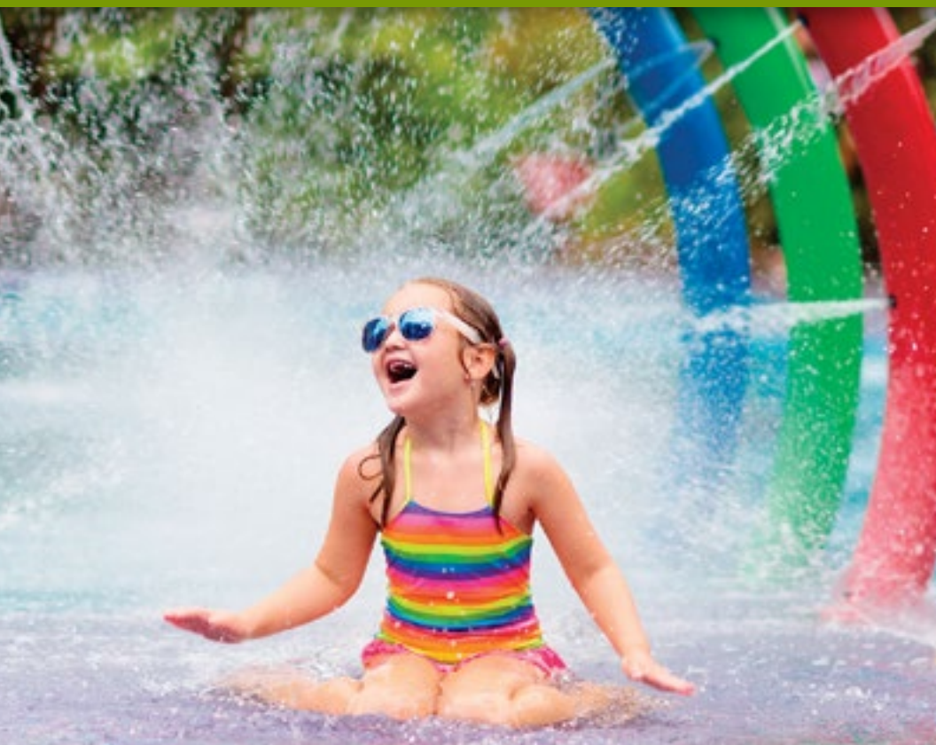
Parque de chorros para niños