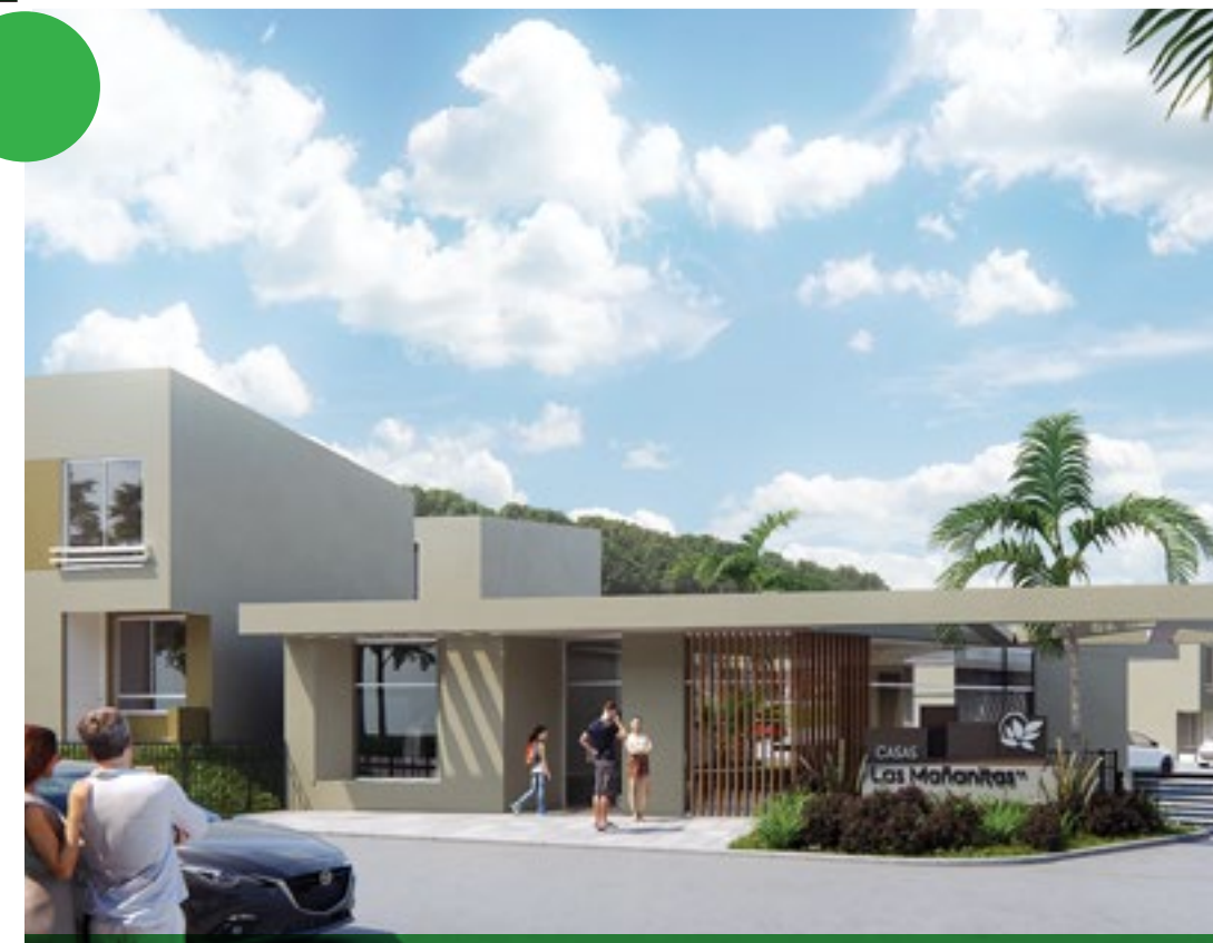
Amplia portería de acceso

Proyecto VIS. Aplica subsidio, recibimos todas las cajas de compensación.